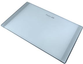
Tabla de corte de cristal 8633 300